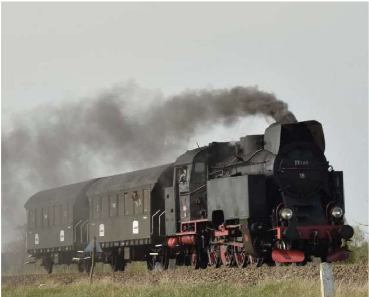
Fot. Paweł Chojodniak